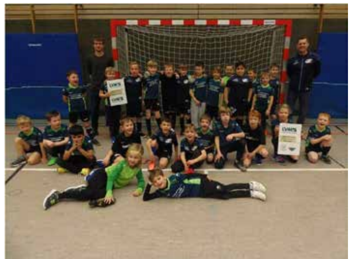
F-Junioren des TSV Holzheim

Bei den F-Junioren und den Bambini`s wurden Spieltage ausgetragen. Hier wurden keine Ergebnisse geführt. Der gemeinsame Spaß am Fußball stand hier im Vordergrund.