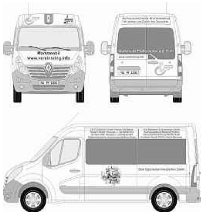
Das neue Marktmobil ab August. Vielen Dank den Sponsoren!

Leider hat das alte Fahrzeug derzeit einen Defekt nach dem anderen. Auch kam es zu zwei Unfällen, weshalb ein weiterbetrieb mit diesem Fahrzeug nicht mehr rentabel ist. Anfang August wird das neue Marktmobil in Dienst gestellt werden. Wir haben einen Renault Master L2H2 bestellt. Das Fahrzeug verfügt zusätzlich über ein automatisches Getriebe, Rückfahrkamera, Navigationssystem und Trittsstufe an der hinteren Türe. Es hat einen ca. 30 cm längeren Kofferraum und ist insgesamt knapp 20 cm breiter als das Bisherige. Wir bedanken uns bei allen Sponsoren die Unterstützung: Aichinger Finanz, Aral Tankstelle Schlumberger GmbH, Autohaus Rudolf ROGG GmbH Illertissen, Bäckerei Stetter, BATS-Feuerschutz, Endres Immobilien, Georg Reitzle Heizung-Sanitär-Solar, Gewerbeverband Pfaffenhofen, Gold Elektrotechnik, Hörgeräte Bösch, HS PLANHAUS GmbH, Konrad Jahn Bonnfinanz Pfaffenhofen, Mosterei u. Getränkemarkt Gerhard Hiller, Naturheilpraxis Christine Fliegel, NewTec GmbH, Rathaus Apotheke, Raumausstattung Manfred Hommel, Richard Reitzle Heizungs- u. Sanitärtechnik, Schlossbrauerei Autenried, VR-Bank in Pfaffenhofen, Württembergische Versicherung Andreas Boser